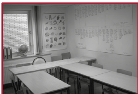
Des classes supplémentaires pour nos cours de français.

Tout don supérieur ou égal à 30 Euros versés en une ou plusieurs fois au cours de l'année sur l'un de nos comptes en Belgique donne droit à une quittance d'exonération fiscale.