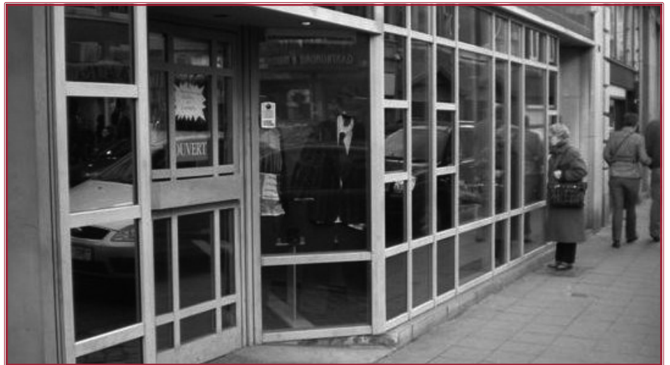
Au 13-15 de la rue Puits-en-Sock,....

• On reçoit en effet de plus en plus de subsides, signe que les pouvoirs publics reconnaissent notre professionnalisme et la plus-value qu'un service privé comme le nôtre apporte à l'effort général de