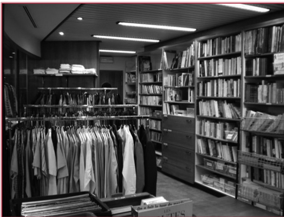
... un cadre accueillant où trouver livres et vêtements

Un tout grand merci à nos amis volontaires qui ont empaqueté, déménagé, déballé des m 3 de marchandises pour nous permettre de rendre à temps les clés de l'ancien magasin et de redémarrer rapidement la vente Rue Puits-en-Sock.